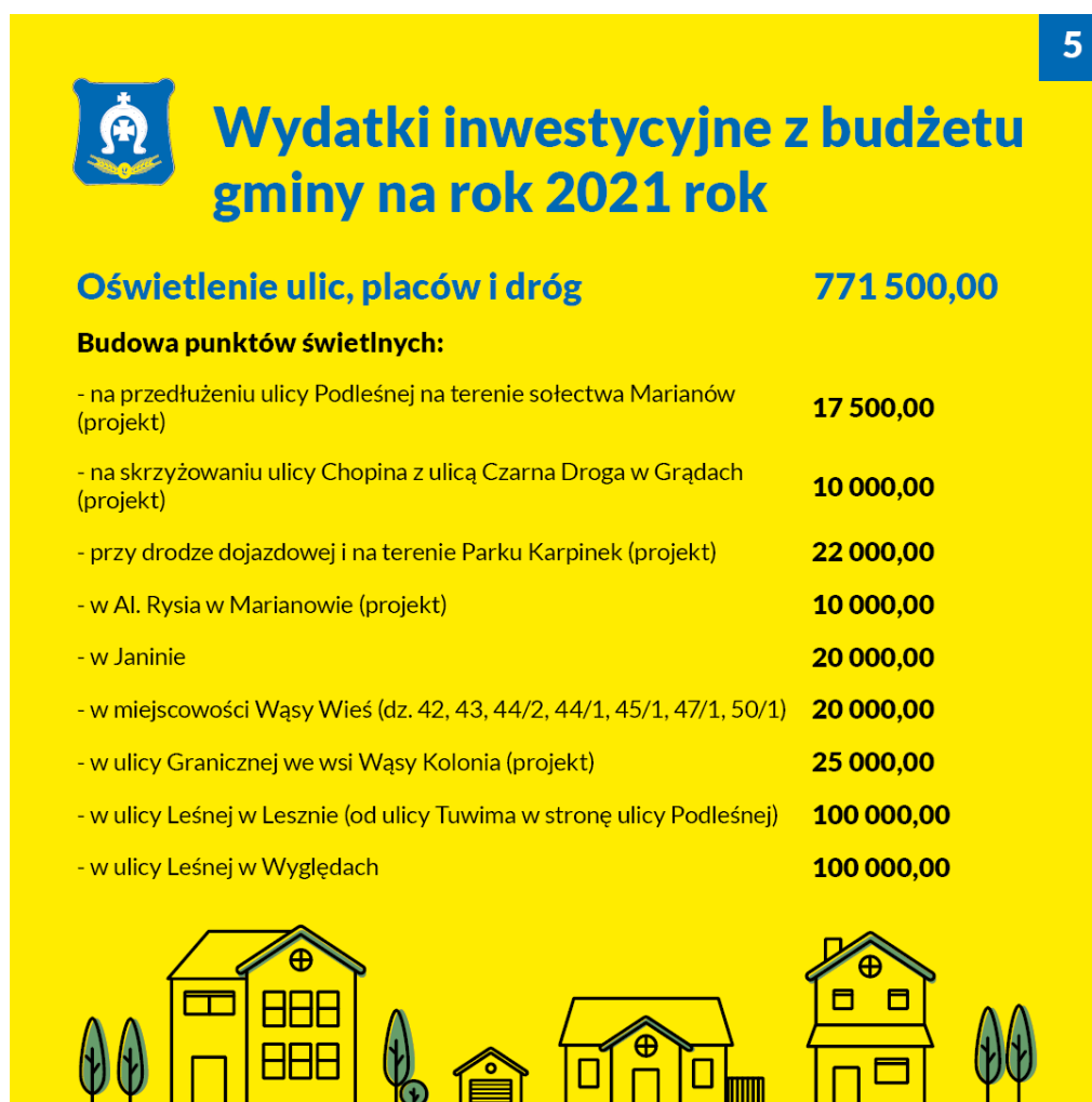
Rysunek 2. Wydatki inwestycyjne z budżetu gminy na rok 2021 gminy Leszno

Podstawowym dokumentem dla kontroli i oceny wykonania budżetu przez organ stanowiący JST, jest roczne sprawozdanie z wykonania budżetu (Wszechnica FWW, 2017). Coraz więcej gmin decyduje się na korzystanie z portali społecznościowych, gdzie zamieszczają informację o kondycji finansowej jednostki. Przykładem tego jest rysunek 2.